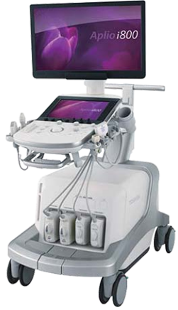
<キャノンメディカル Aplio i800>