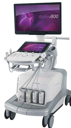
<キャノンメディカル Aplio i800>